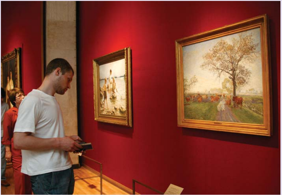
Выставка «Европа-Россия-Европа». Государственная Третьяковская галерея, май-июль 2007 г.