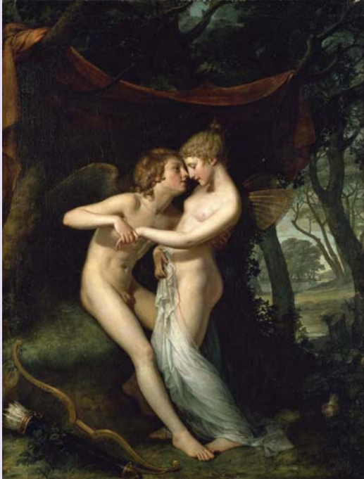
Хью Дуглас Гамильтон (1740–1808), «Амур и Психея» (1792-93), масло, холст. Собрание: Национальная галерея Ирландии. Эта картина выставлялась на выставке «Европа – Россия – Европа» в Государственной Третьяковской галерее в Москве в мае 2007 г.

Следует отметить, что еще не все разделы Закона о национальных культурных учреждениях от 1997 г. введены в действие.