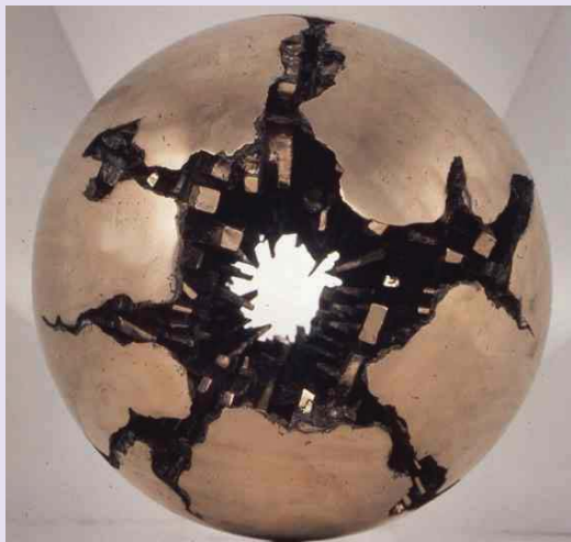
«Сфера с перфорацией» Арналдо Помодоро.

Работа Помодоро была представлена в 2006 г. в Манеже в Москве на выставке итальянского дизайна «Миф и скорость». В 1991 г. его «Солнечный диск» – дар кабинета премьер-министра Италии Советскому Союзу – был установлен перед Дворцом молодежи в Москве, в настоящее время его можно увидеть во дворе Московского музея современного искусства.