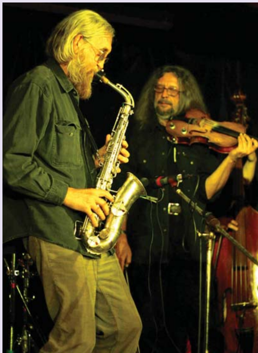
Концерт рок-группы Plastic People of the Universe из Праги, Чешская Республика. Эта группа являлась ярким представителем культуры пражского андеграунда 1970–1980 гг. В ходе гастролей по России в ноябре 2006 г. группа выступила в Нижнем Новгороде, в московском «Клубе на Брестской» и в Санкт-Петербурге в клубе «МОД».

вывоз, согласно чешскому национальному законодательству. Более подробная информация о том, какова разница между этими лицензиями, приводится ниже.