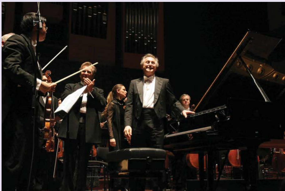
Филармонический оркестр Люксембурга, выступающий в Люксембурге в январе 2007 г. под управлением российского дирижера Владимира Федосеева.

ставки, статья 24, статья 25: Культурные ценности, статья 26: Охрана исторических и культурных памятников).