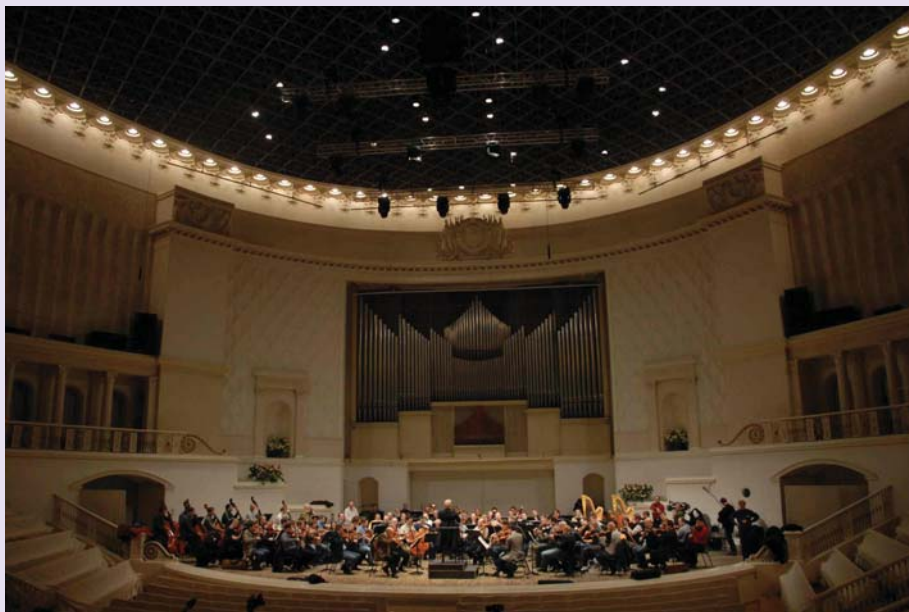
Репетиция Венского филармонического оркестра в Концертном зале имени П.И. Чайковского перед концертом в феврале 2007 года.

Правило BGB1. II Nr 484/1999 дает более подробную информацию по категориям культурных ценностей, которые не требуют обращения за разрешением на вывоз. Определенные виды культурных ценностей требуют разрешения на вывоз независимо от их стоимости; к ним относятся предметы из археологических раскопок, предметы, находящиеся на территории исторических памятников, и автографы (рукописи, письма, документы, написанные от руки и т.д.).