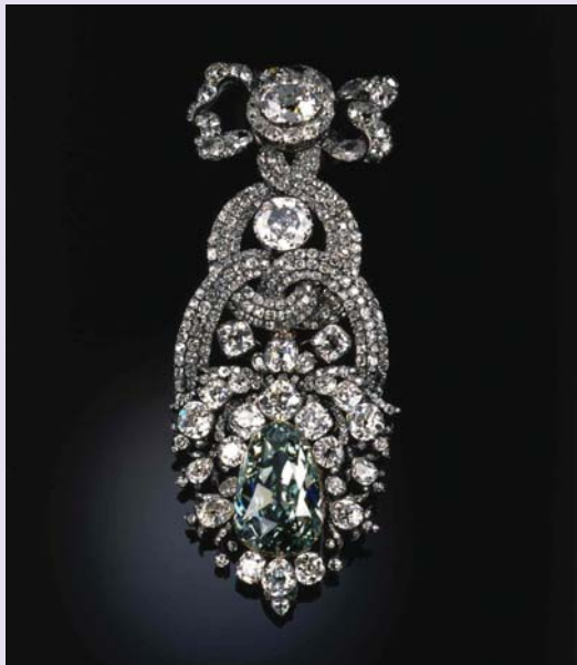
Украшение для шляпы с «Зеленым бриллиантом из Дрездена» (1768-69) из собрания музея «Зеленые своды» ( Grünes Gewölbe ) в Дрездене (аналог Оружейной палаты Московского Кремля). Выставлялось в Патриаршем дворце Музеев Московского Кремля с мая по август 2006 года как часть основной экспозиции коллекции. «Зеленые Своды» пользуются мировой известностью как одна из самых богатых европейских сокровищниц.

Для вывоза незарегистрированных культурных ценностей (т.е. не внесенных в реестр), но подпадающих под действие законодательства ЕС (См. главу 2 по категориям, стоимостному и возрастному лимитам) лицензии ЕС на вывоз выдают лицензионные органы шестнадцати земель Германии. В некоторых землях имеется более одного лицензионного органа, и часто они делятся на органы, работающие с культурными ценностями, и органы, работающие с архивами.