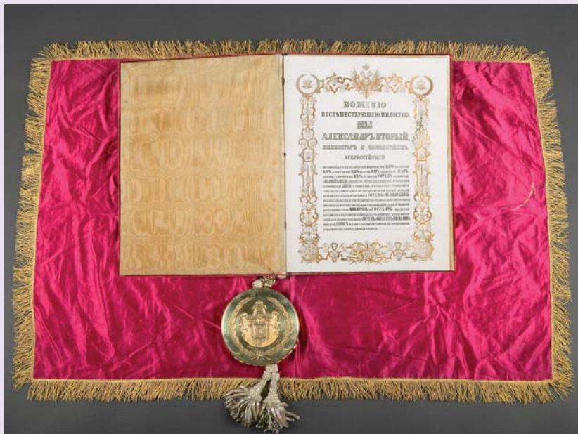
Брачный контракт принцессы Дагмар и цесаревича Александра, 1866 г.