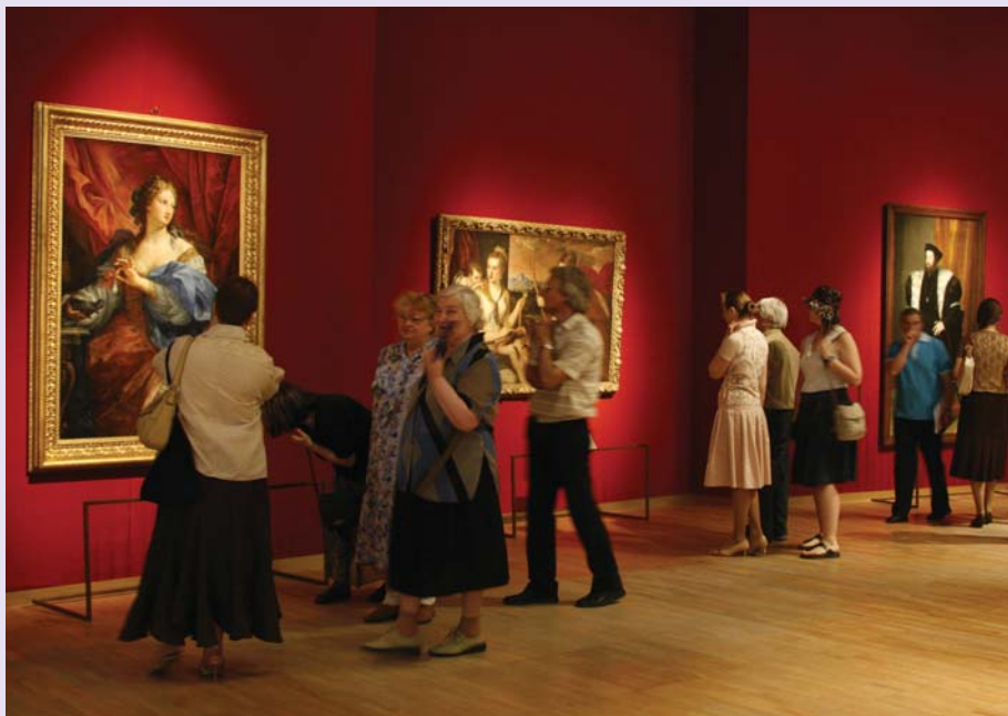
Выставка «Европа-Россия-Европа». Государственная Третьяковская галерея, май-июль 2007 г.