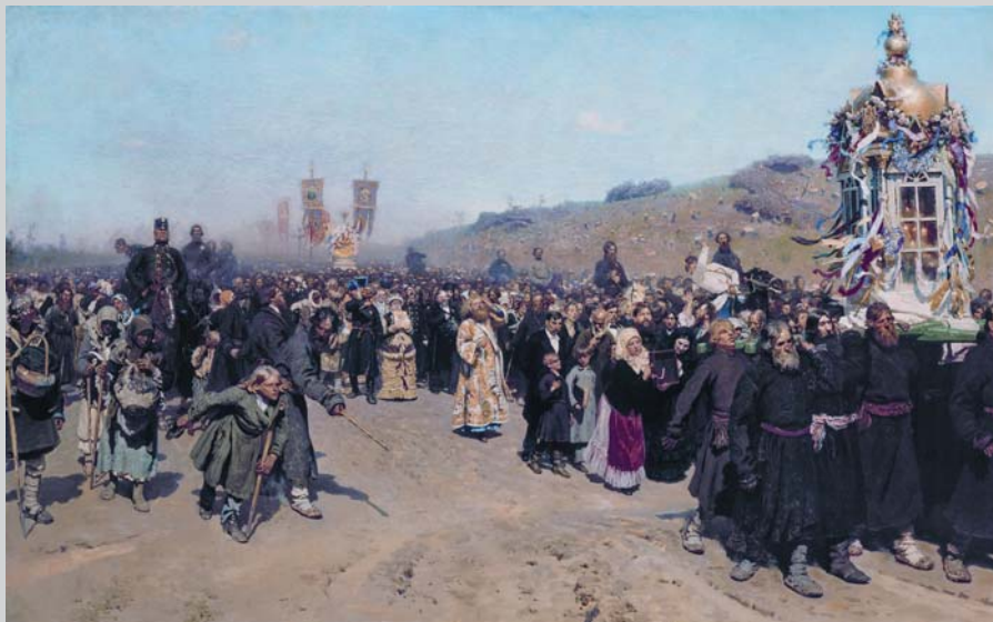
Репин И.Е., «Крестный ход в Курской губернии», 1881-1883. Холст, масло.