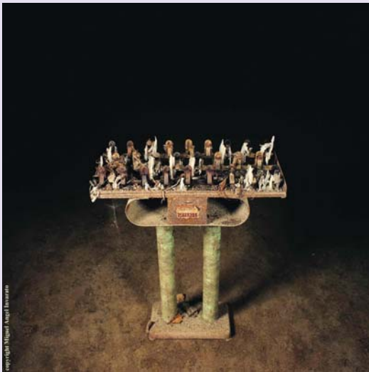
скульптура Мигеля Анхеля Инварато

Фоторабота Мигеля Анхеля Инварато, выставленная в Институте Сервантеса в Москве в 2007 г. Выставка Мигеля Инварато «Из тьмы к свету. Черепа кладбища Фонтанелле» демонстрирует серию фоторабот, иллюстрирующих пещерное кладбище в Неаполе.