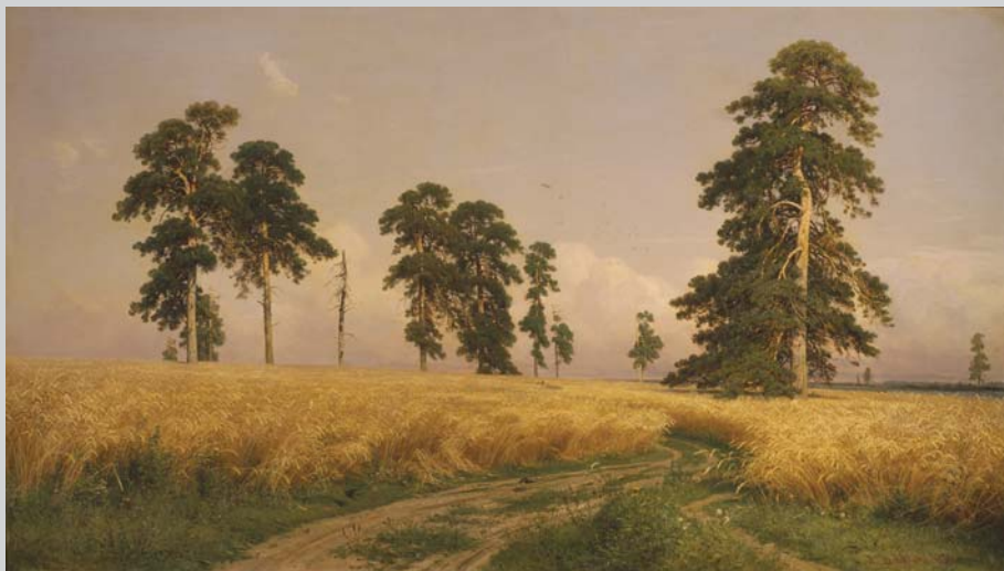
Шишкин И.И., «Рождь», 1878. Холст, масло. Государственная Третьяковская галерея. Картина выставлялась на выставке русского пейзажа (Гронинген, Лондон, 2003-2004).